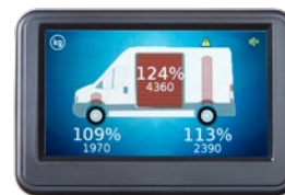
Waarschuwing voor bruto overbelading