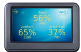
Elke as weergegeven als percentage

Airedale House | Canal Road | Bradford BD2 1AG Tel: +44 (0)1274 771177 | Fax: +44 (0)1274 781178 E-mail: obw.eur@vpgsensors.com