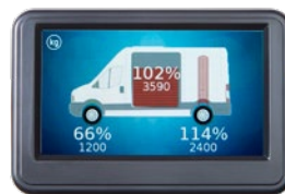
Waarschuwing overbelasting achteras